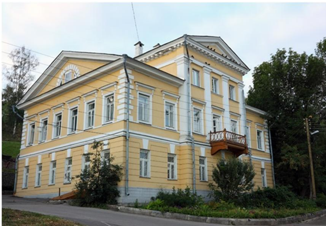
Фото 4. Объект культурного наследия регионального значения (источник: https://opendata.mkrf.ru/opendata/7705851331-egrkn/66/375829 ).

Зоны охраны: располагается в границах зон охраны объекта культурного наследия федерального значения «Церковь Рождества Богородицы (Строгановская) с колокольней», утвержденных Постановлением Правительства Нижегородской области от 30.12.2013 № 1024.