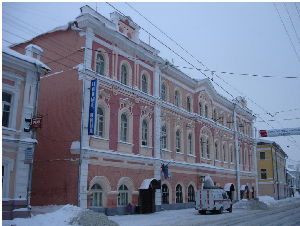
Фото 3. Объект культурного наследия регионального значения (источник: https://opendata.mkrf.ru/opendata/7705851331-egrkn/66/436858 ).

Зоны охраны: располагается в границах зон охраны объекта культурного наследия федерального значения «Церковь Рождества Богородицы (Строгановская) с колокольней», утвержденных Постановлением Правительства Нижегородской области от 30.12.2013 № 1024.