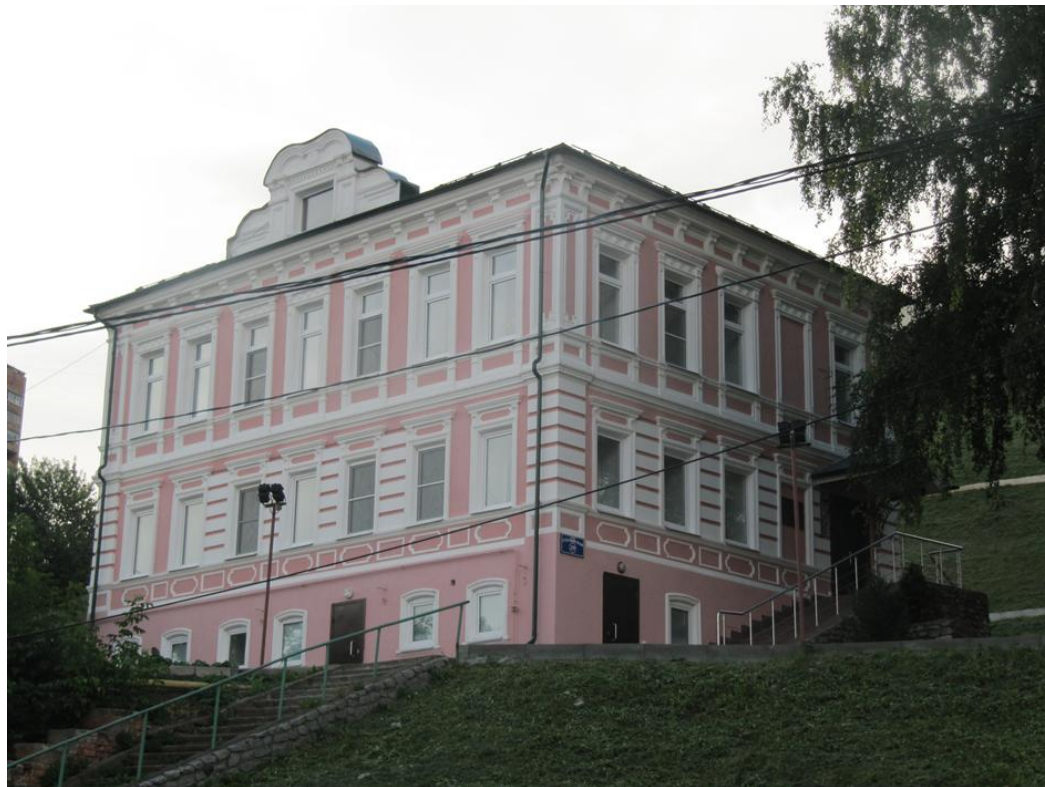
Фото 2. Объект культурного наследия регионального значения (источник: https://opendata.mkrf.ru/opendata/7705851331-egrkn/66/437128 ).

Зоны охраны: располагается в границах зон охраны объекта культурного наследия федерального значения «Церковь Рождества Богородицы (Строгановская) с колокольной», утвержденных Постановлением Правительства Нижегородской области от 30.12.2013 № 1024.